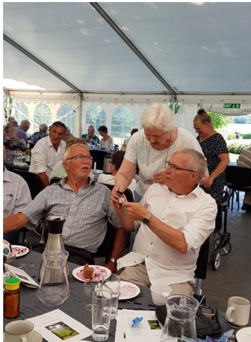
En tabt bilnøgle