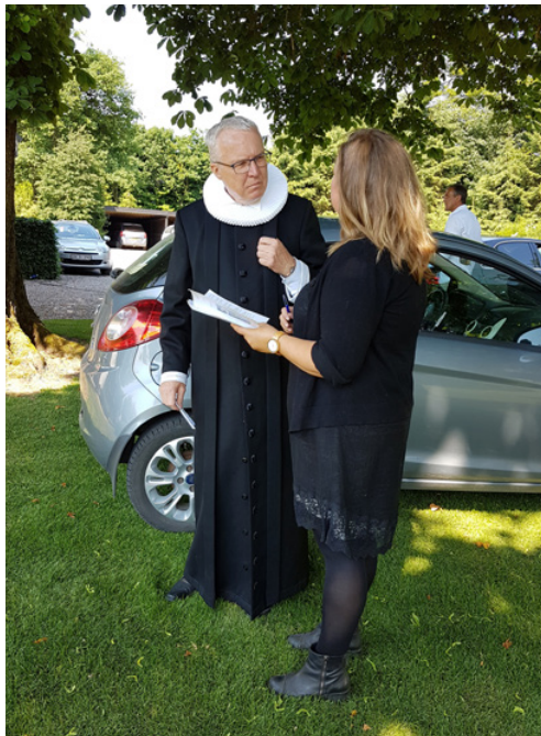
De sidste detaljer skal på plads